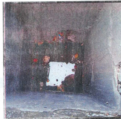
Evidencia de Revisión de Bocas de Tormenta.