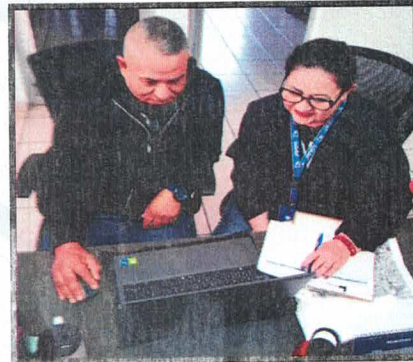
Evidencia de la entrevista con el supervisor.